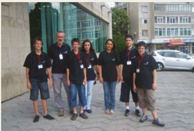
- Zajedno sa Fondacijom ArcelorMittal Zenica podržali smo odlazak na olimpijadu informatičkog tima Bosne i Hercegovine, koji se ove godine održavao u Bugarskoj.