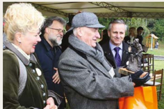
-U saradnji sa opštinom Prijedor Fondacija tradicionalno sponzorise Književne susrete na Kozari i dodjeljuje statu u rudara laureatu Susreta.