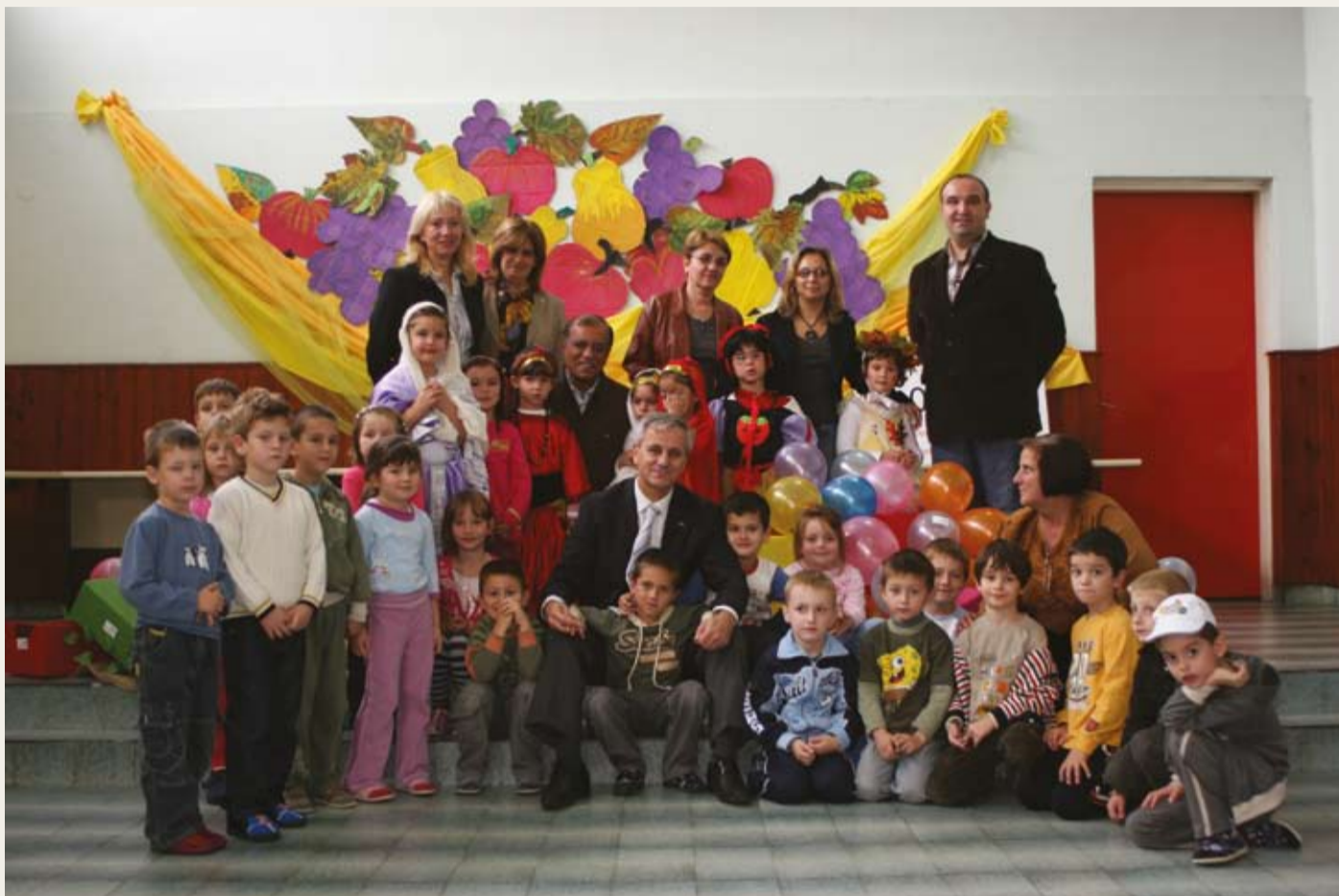
- Saradnja sa Dječijim vrtićem „Radost“, kojeg pomažemo već treću godinu za redom u okviru „Nedelje djeteta“.

ArcelorMittal Prijedor sa ponosom predstavlja neke od naših projekata implementiranih u 2008 godini: