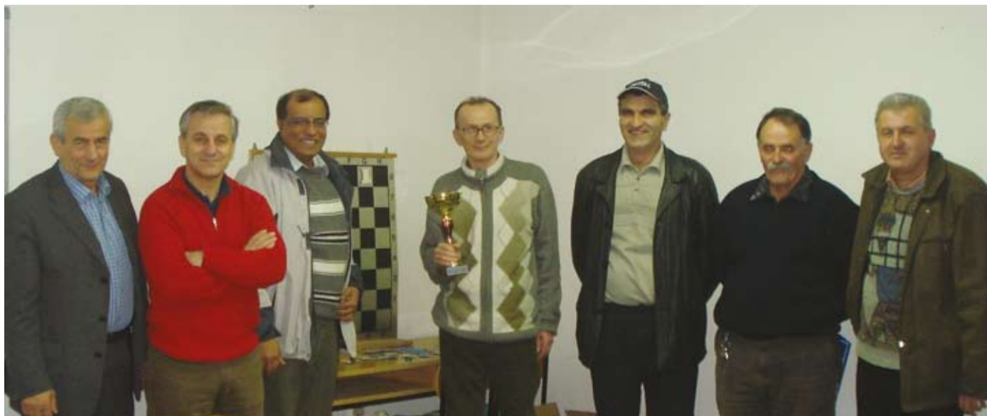
Šahisti preduzeća ArcelorMittal Prijedor

želja da se organizuje škola šaha za učenike osnovnih škola. Na taj način izvršilo bi se omasovljavanje kluba, jer bi njegovi članovi postali najbolji polaznici ove škole. To bi omogućilo klubu da izađe i na zvanična takmičenja za mlade kategorije. Šahovski klub Rudar još uvijek nema svoje prostorije, što je jedan od značajnih preduslova za dobar rad i prelazak u viši rang takmičenja.