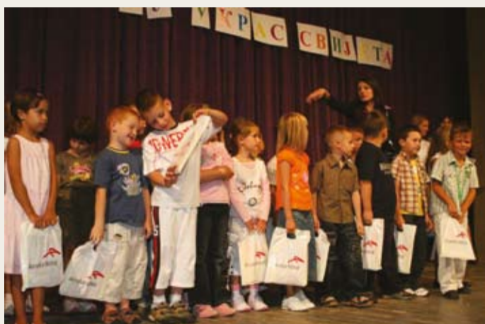
- Prvog dana škole ArcelorMittal je sjeo u školske klupe sa 700 prvaca u prijedorskoj opštini i donirao im poklon pakete sa školskim priborom i prslucima za saobraćaj.