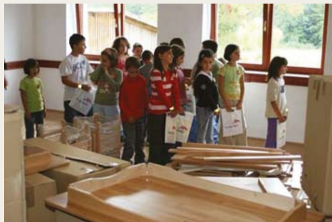
- Ove godine smo sa početkom školske godine pomogli i opremanje područne škole u Ljeskarama zajedno sa našim osnivačem RZR „Ljubija“ a.d.