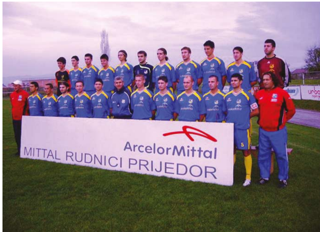
FK Rudar Prijedor

Od 1996 godine Rudar Prijedor počinje novu eru. Vremena teška. Besparica i sve teži uslovi za očuvanje najtalentovanih i najboljih igrača. Igrači odlaze u ekipe sa više novca. Tako je Rudar Prijedor u tom periodu oscilirao u kval-