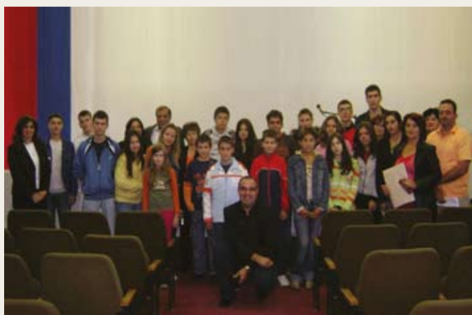
- I ove godine, kao i prethodnih, nismo zaboravili djecu naših preminulih radnika, kojima smo na početku školske godine donirali poklon vaučere.