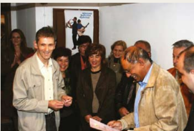
- Pomoć u otvaranju i radu Udruženja „Anemona“, čiji su članovi građani koji boluju od astme i KOPB, pomoć novoosnovanom Udruženju oboljelih od diabetesa.